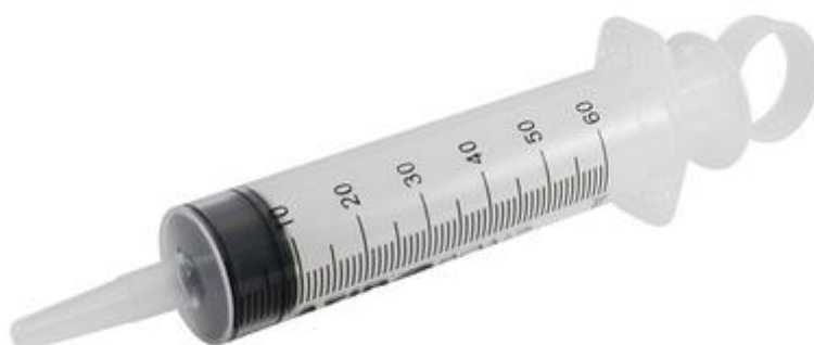
Bild: 60ml Spritze die wir verwenden

Um den Abfüllvorgang zu starten, zuerst in den oberen Schlauch Honig einfüllen, z.B. mittels einer grossen Spritze, so dass er in die Zahnrادpumpe läuft. Anschliessend kann mit dem Abfüllen, entweder im Automatik Mode oder manuell, begonnen werden. Im Automatik Mode erkennt die Maschine, wenn ein Glas (Trigger Gewicht) auf die Waage gestellt wird und beginnt mit dem füllen des Glases.